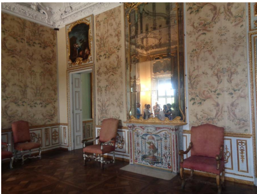
Interiér Villa Della Regina