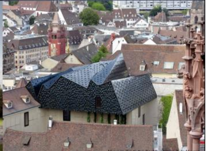
Museum für Kultur, Basel, Herzog & de Meuron