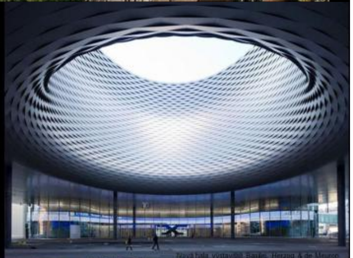
Nová hala výstavního domu, Herzog & de Meuron