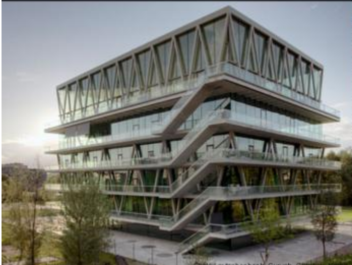
Centre for Architecture, Gherghel, Gherghel