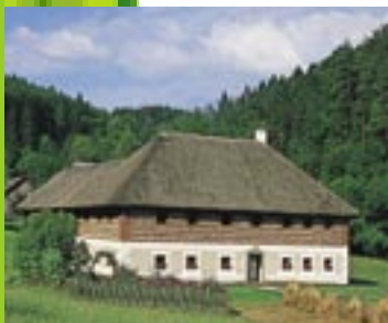
Farmhouse / Austria