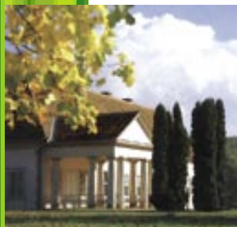
Manor House / Croatia