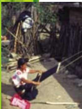
Traditional weaving / Mexico