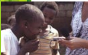
Oral history / Kenya

ICR believes in learning by sharing and in cross-border approaches (geographic, academic, professional, cultural, organizational) as a precondition for mutually beneficial exchanges of skills, experiences and ideas.