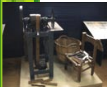
Museum of Cork / Spain