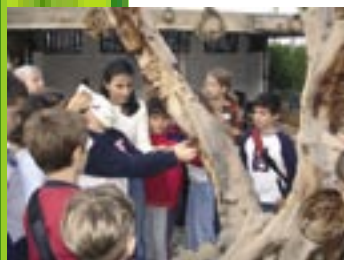
Education program / Crete

L'ICR croit en l'apprentissage sur la base du partage et des approches transfrontaliers (géographique, académique, professionnel, culturel et organisationnel) et le considère comme une condition préalable à un échange mutuel et bénéfique de savoir-faire, d'expériences et d'idées.