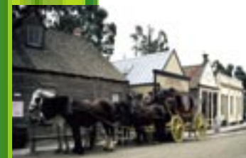
Gold mining village / Australia

ICR cree en el aprendizaje compartido y en los contactos (geográficos, académicos, profesionales, culturales y organizacionales) más allá de las fronteras, como precondition para intercambios de conocimientos, experiencias e ideas, que generen beneficios mutuos.