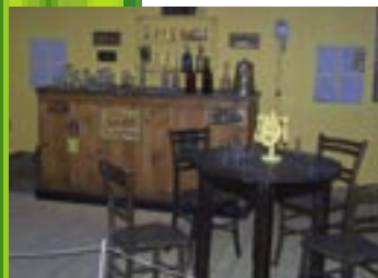
Traditional Pub / Slovenia