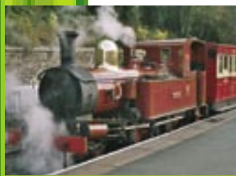
Historic train / Isle of Man