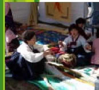
Traditional dishes / Korea