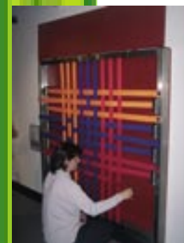
Learning about cotton / UK